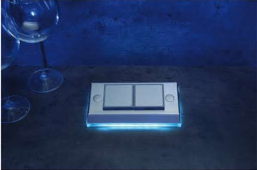
Montage auf der Arbeitsplatte